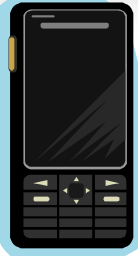
作業者端末 (携帯電話)