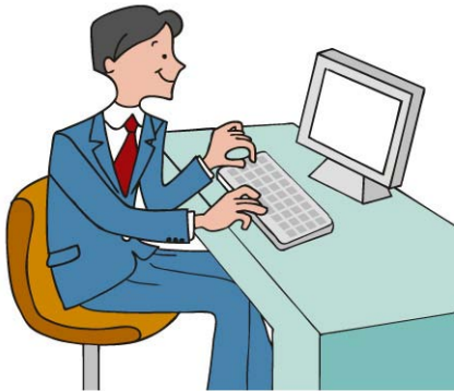
【食品関連企業(ユーザ)様】